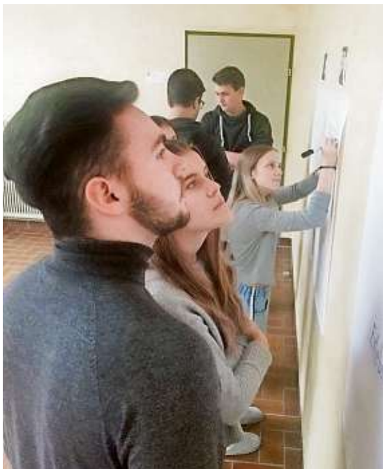
Die Schülergruppen gingen konzentriert und voller Tatendrang ans Werk