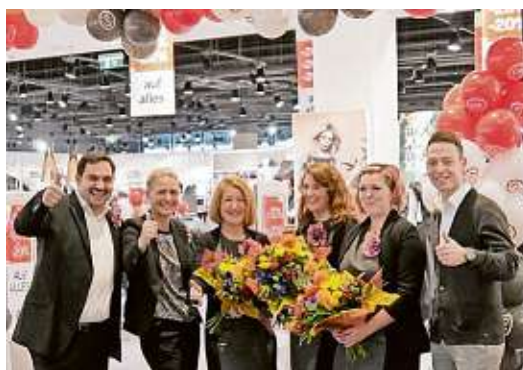
Gestern wurde die Filiale von C&A im ELI in Liezen eröffnet ELI

lich an der Optimierung unseres Storeportfolios und sind laufend auf der Suche nach attraktiven Standorten. Sowohl aus strategischer als auch aus wirtschaftlicher Perspektive ist die Übernahme der drei Vögele-Filialen von hoher Bedeutung für C&A“, erläuterte Norbert Scheele im Rahmen der Eröffnungsfeier.